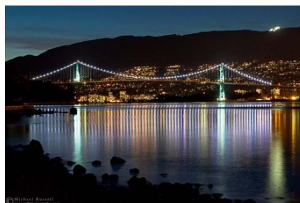
Lions gate bridge