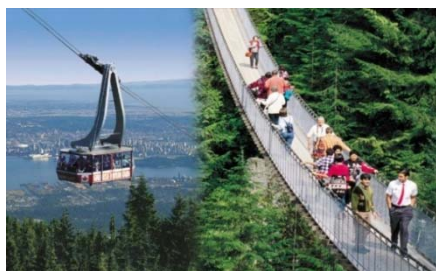
Capilano Suspension Bridge + Grouse Mountain